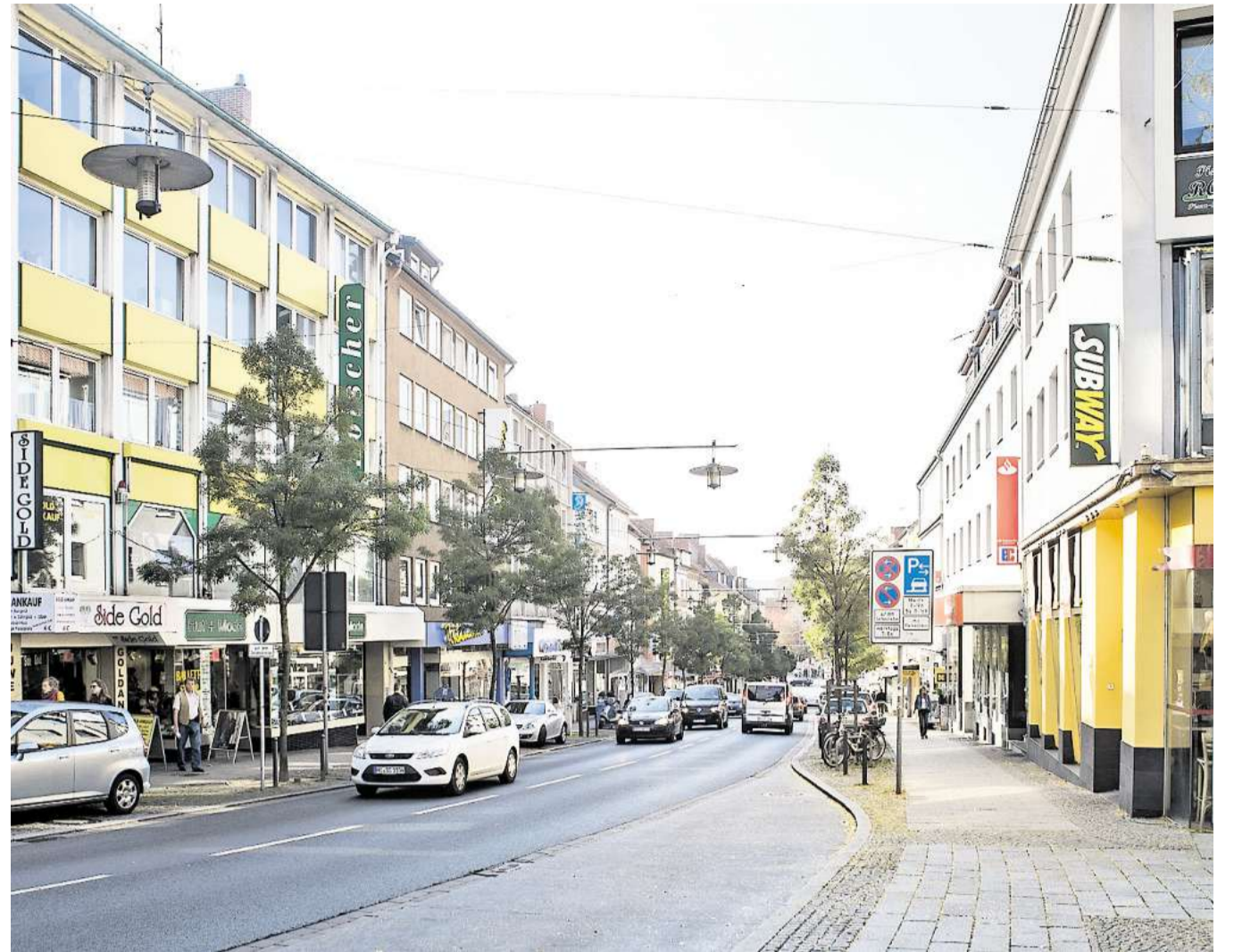
Die heutige Schuhstraße ist deutlich breiter, gerader und flacher. Von den alten Bauwerken ist nichts mehr zu sehen – nicht einmal das charmante Ecktürmchen der alten Stadtsuperintendentur.