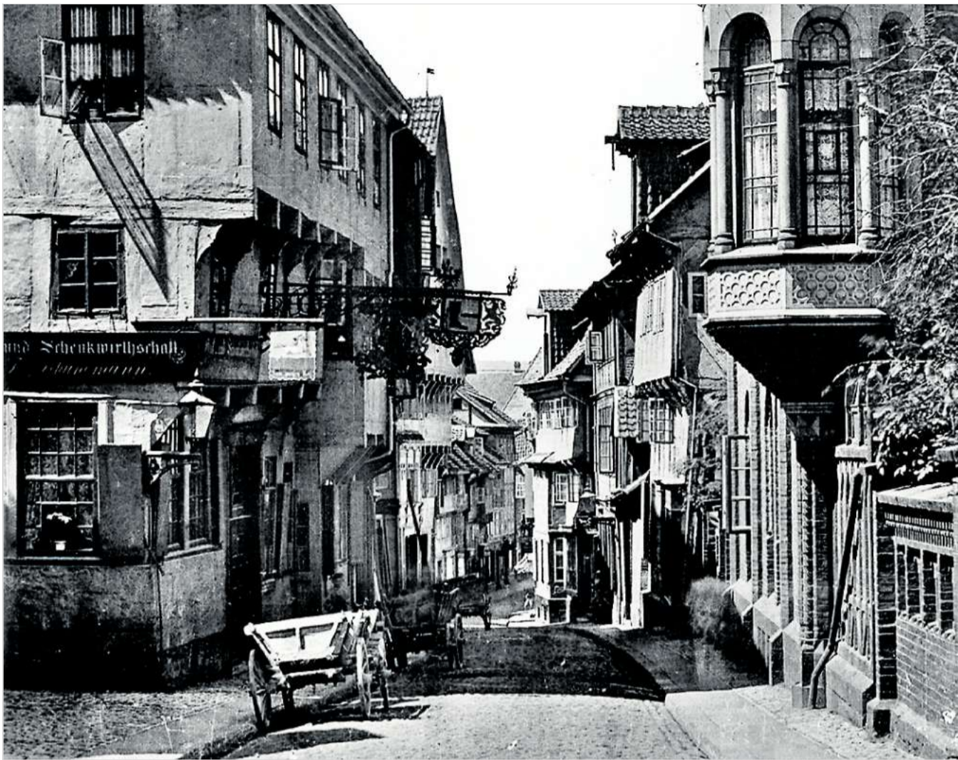
Blick bergab in die Schuhstraße vor rund 100 Jahren. Nomen est omen: In der Straße lebten und arbeiteten im Mittelalter zahlreiche Schuhmacher.