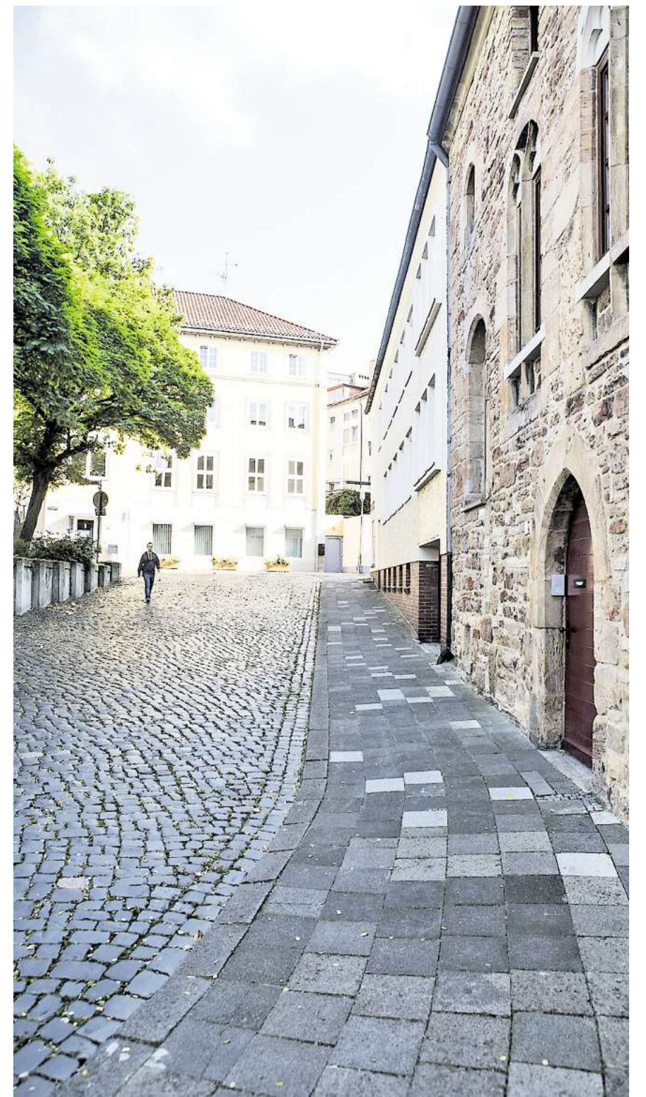
Alte Münze und Kopfsteinpflasterweg sehen aus wie vor 80 Jahren. Im Hintergrund ist das Gemeindehaus der Andreasmünze zu sehen.